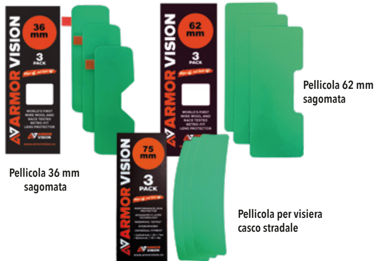
Pellicola 36 mm sagomata